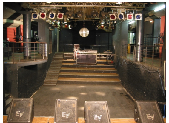
Blick von der Bühne in den Saal